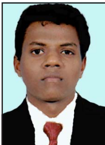
ഇ.വാ. സുമേഷ് പി. ലാസർ തെങ്ങമം

കണ്ടുനില്ക്കുന്ന ക്രൂശിലെ കളൻ! മോഷ്ടിക്കാതെ കവർച്ച ചെയ്യാതെ നിരപരാധിയായിരുന്നിട്ടും നീചമായ ക്രൂശുമരണത്തിന് വിധിക്കപ്പെട്ട യേശുവിന്റെ ക്രൂശ് അവന്റെ തീരാവേദനയിലും അവനെ ആകർഷിച്ചു. ക്രൂശിതനായ യേശുവിന്റെ ക്രൂശിന് മറ്റൊരുവന്റെ വേദന മാറ്റാൻ കഴിയുന്നു. ക്രൂശ് ഏറ്റവും നിന്ദയമായിരുന്നെങ്കിലും ആ കളന്റെ ദൃഷ്ടിയിൽ യേശു